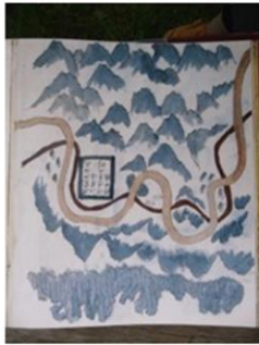
Voyage d'une ambassade vietnamienne en chine, XVIIIe siècle